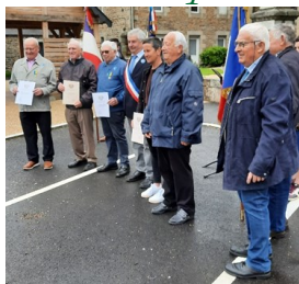
Cérémonie du 8 mai

Chasse aux œufs : le dimanche de Pâques au lieu-dit Lespicot.